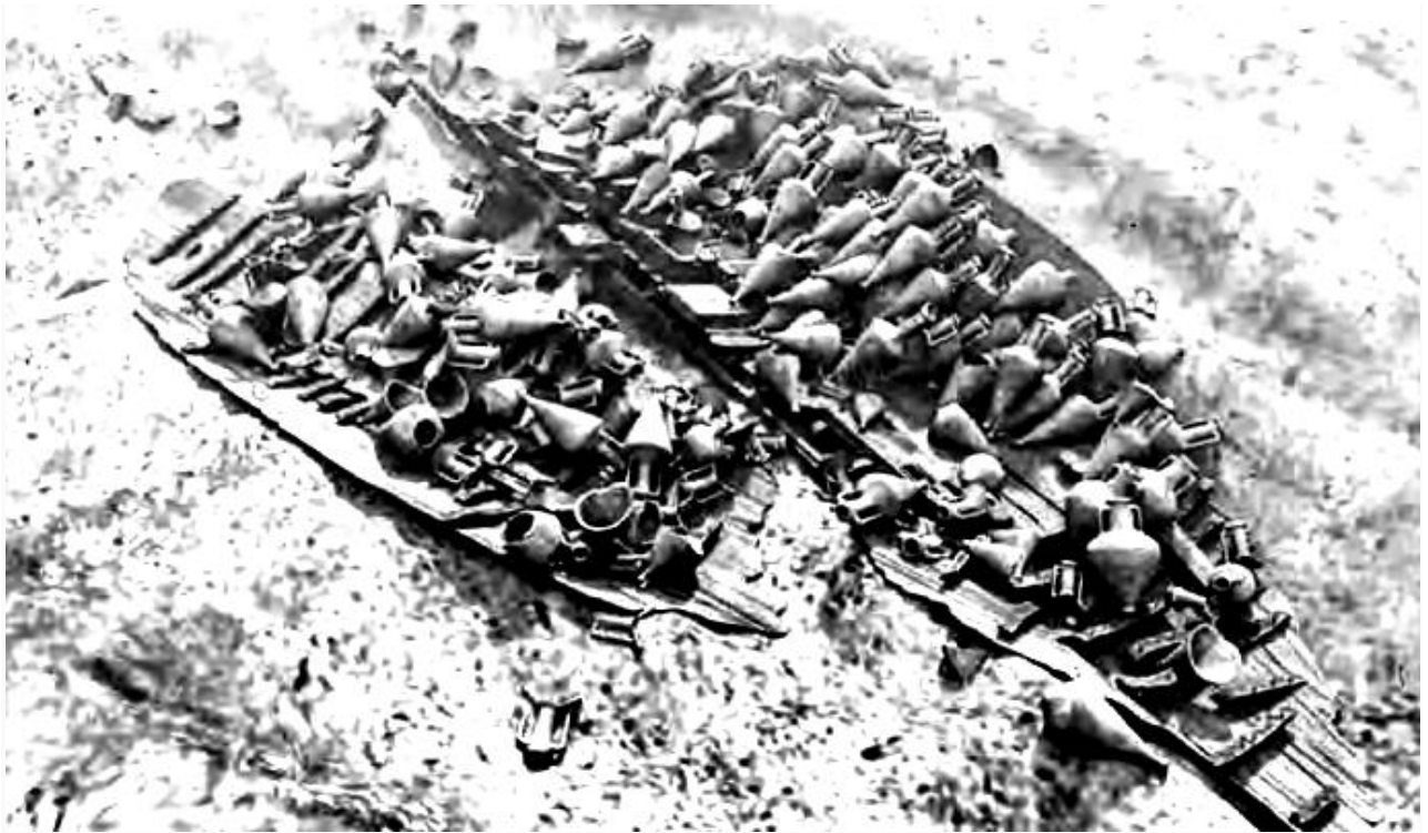
Το αρχαίο ναυάγιο στο βυθό της θάλασσας της Κερύνειας

Αρχίζοντας από την κατασκευή του, εκτός από το είδος του ξύλου (πεύκος Pinus Halerepenis ) και τη χρονολογία της κατασκευής του (389 π.Χ.), γνωρίσαμε και την παραδοσιακή μέθοδο κατασκευής των σκαφών της εποχής εκείνης, «πρώτα μαδέρωμα» ( shell first ), ότι δηλαδή οι αρχαίοι караβομαραγκοί κατασκεύαζαν πρώτα το εξωτερικό περίβλημα, τα μαδέρια, και μετά το εσωτερικό, τους σκαρμούς, που αποτελούσαν τον σκελετό του σκάφους, σε αντίθεση με τη μέθοδο που ακολουθούν σήμερα, «πρώτα σκαρμοί».