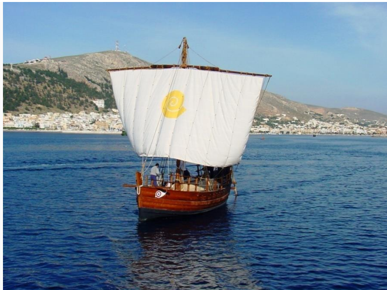
Το «Κερύνεια Ελευθερία» στο ταξίδι του στην Ελλάδα το 2004

Στις 14 Μαΐου, και ενώ το πρωινό ανατολικό αεράκι φούσκωνε πρίμα το πανί του, φάνηκε να το χαιρετά από ψηλά, σαν άλλος Αιγέας, ο ναός του Ποσειδώνα στο Σούνιο. Η χαρά και η συγκίνηση που δημιουργούσε η συναίσθηση του τέλους του ταξιδιού, μαζί με τον φουσκωμένο καιρό, γύρω στο μεσημέρι, το βρήκαν έξω από το λιμάνι του Πειραιά, να περνά ανάμεσα στους τεράστιους κολοσσούς της σύγχρονης ναυσιπλοΐας, που από σεβασμό στο μέγεθος και την ιστορία που κουβαλούσε, παραμέριζαν για να περάσει και το χαιρετούσαν με τις σειρήνες τους.