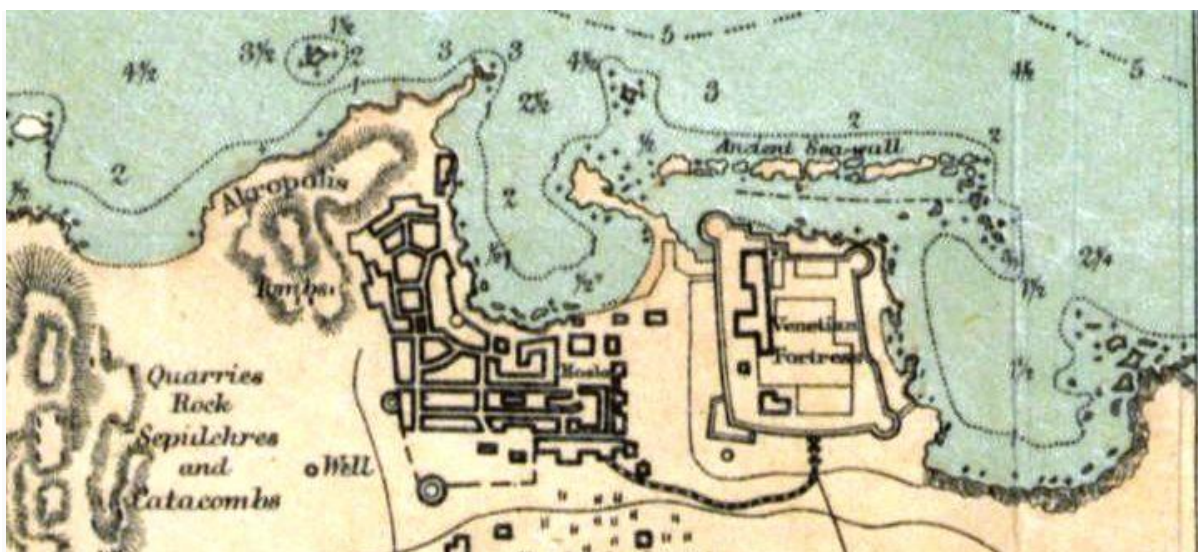
Η ακτογραμμή της Κερύνειας

Παρόλο που δεν υπάρχουν οποιοδήποτε χάρτες που να δείχνουν την ακτογραμμή και τη μορφολογία του εδάφους της περιοχής της πόλης της Κερύνειας κατά την αρχαιότητα, αυτή δεν πρέπει να έχει αλλάξει πολύ σε βαθμό που να είναι πολύ διαφορετική από εκείνη που περιγράφεται στον πιο κάτω χάρτη του Άγγλου υδρογράφου Captain Thomas Graves 14 , που τον ετοίμασε το 1849 που επισκέφθηκε την Κύπρο.