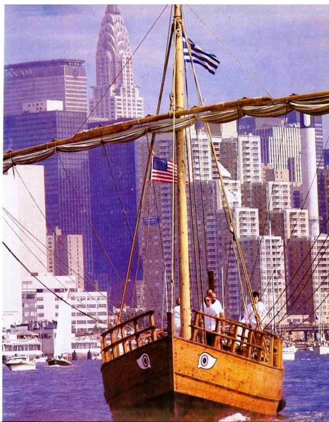
Το Κερύνεια II στη Νέα Υόρκη

Το εγχείρημα όπως αναμενόταν, δεν ήταν καθόλου εύκολο. Το ομοίωμα θα είχε ακριβώς τις ίδιες διαστάσεις, θα κατασκευαζόταν με τα ίδια υλικά και την ίδια μέθοδο που κατασκεύασαν το πρωτότυπο οι αρχαίοι ναυπηγοί, χρησιμοποιώντας μια άγνωστη μέθοδο (πρώτα μαδέρωμα), που είχε ήδη εγκαταλειφθεί από τον 7 ο αιώνα μ. Χ.