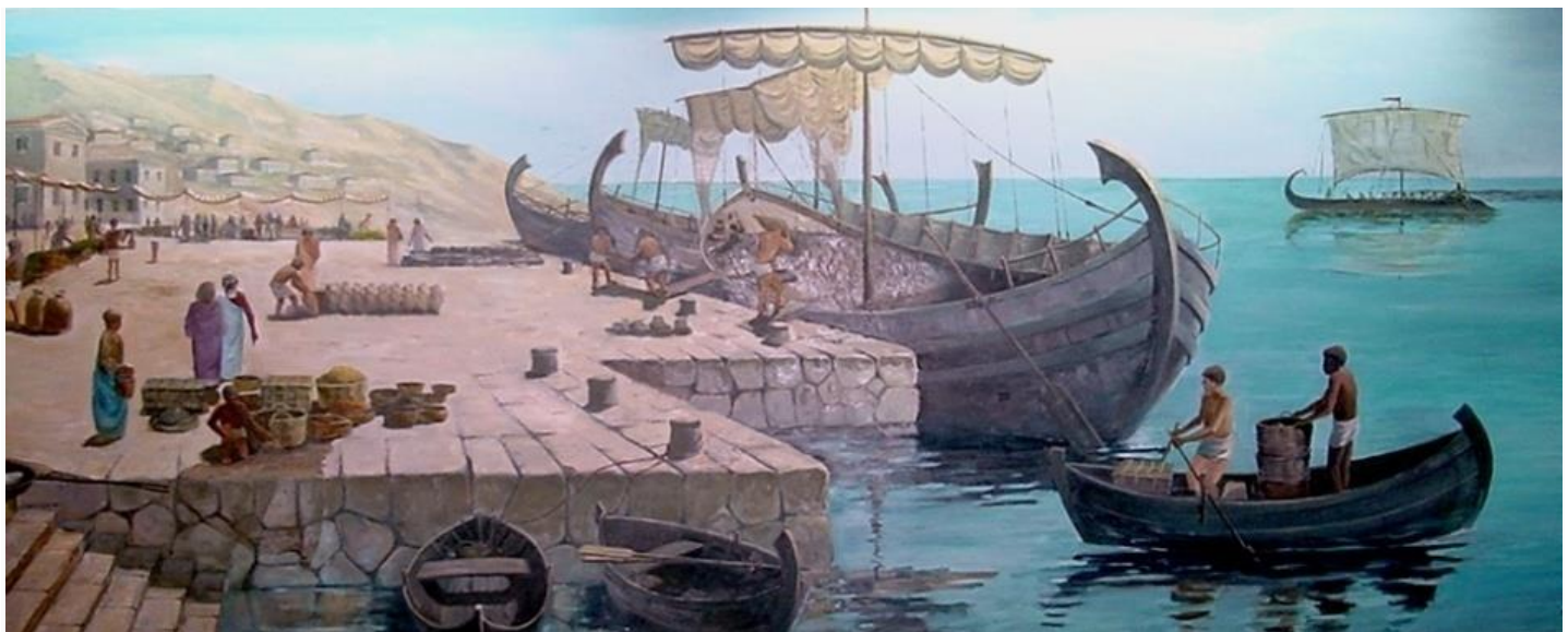
Αναπαράσταση φορτωεκφόρτωσης καραβιών σε λιμάνι της Ελληνιστικής περιόδου

Σήμερα, παρόλο τον εγκλωβισμό και την μη προσβασιμότητα του, το «καράβι της Κερύνειας» εξακολουθεί να αποτελεί ένα σημαντικό κληροδότημα, όχι μόνο για την Κερύνεια και την Κύπρο, αλλά και για ολόκληρη την ανθρωπότητα. Ιστορικά απεδείχθη μια χωρίς προηγούμενο πηγή πληροφοριών για τα ταξίδια και το εμπόριο κατά την Κλασική Περίοδο. Με τη μελέτη του, οι ερευνητές σήμερα ενημερώνονται και κατανοούν μεταξύ άλλων, τις θεμελιώδεις αρχές και πληροφορίες για το φόρτωμα και τη μεταφορά φορτίων αμφορέων, πόσα άτομα χρειαζόνταν για την πλεύση ενός εμπορικού σκάφους της αρχαιότητας, πως οι άνθρωποι αυτοί ζούσαν πάνω σ' αυτό, και πως κατασκευάζονταν και έπλεαν τα πλοία αυτής της εποχής. Από αρχαιολογικής άποψης η ανέλκυση και η σχετική έρευνα έδωσαν θεμελιώδεις πληροφορίες για την περαιτέρω ανάπτυξη της ναυτικής αρχαιολογίας και κάτι εξ ίσου σημαντικό είναι και το γεγονός ότι το καράβι κατέληξε σήμερα να είναι το σύμβολο και να αντιπροσωπεύει και την ίδια την Κύπρο σ' ολόκληρο τον κόσμο.