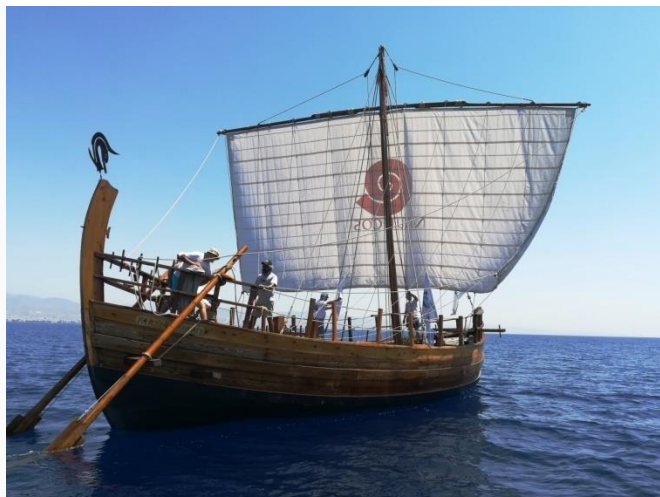
Το Κερύνεια Ελευθερία

Η ανάγκη για μια ολοκληρωμένη και αυτοτελή αναφορά στο «Καράβι της Κερύνειας», συμπλήρωσε την περιγραφή της ιστορίας της ίδρυσης της πόλης από τον Κηφέα και όλων όσων αφορούν την μετέπειτα στενή σχέση της με τη θάλασσα και τις ναυτικές δραστηριότητες. Ταυτόχρονα όμως η αναφορά αυτή γεφύρωσε ιστορικά και χρονολογικά τις προηγούμενες περιόδους με την Κλασική, και αποτέλεσε μια χειροπιαστή και αδιάψευστη μαρτυρία ότι κατά τους χρόνους αυτούς, η Κερύνεια αποτελούσε ένα σημαντικό εμπορικό κόμβο, που διατηρούσε συνεχείς εμπορικές σχέσεις με πολλά από τα τότε γνωστά λιμάνια της ανατολικής Μεσογείου και κάλυπτε ταυτόχρονα τις εισαγωγικές και εξαγωγικές ανάγκες, όχι μόνο της πόλης της Κερύνειας, αλλά, μαζί και με το λιμάνι της Λαπήθου, και ολόκληρης της βόρειας ακτής της Κύπρου.