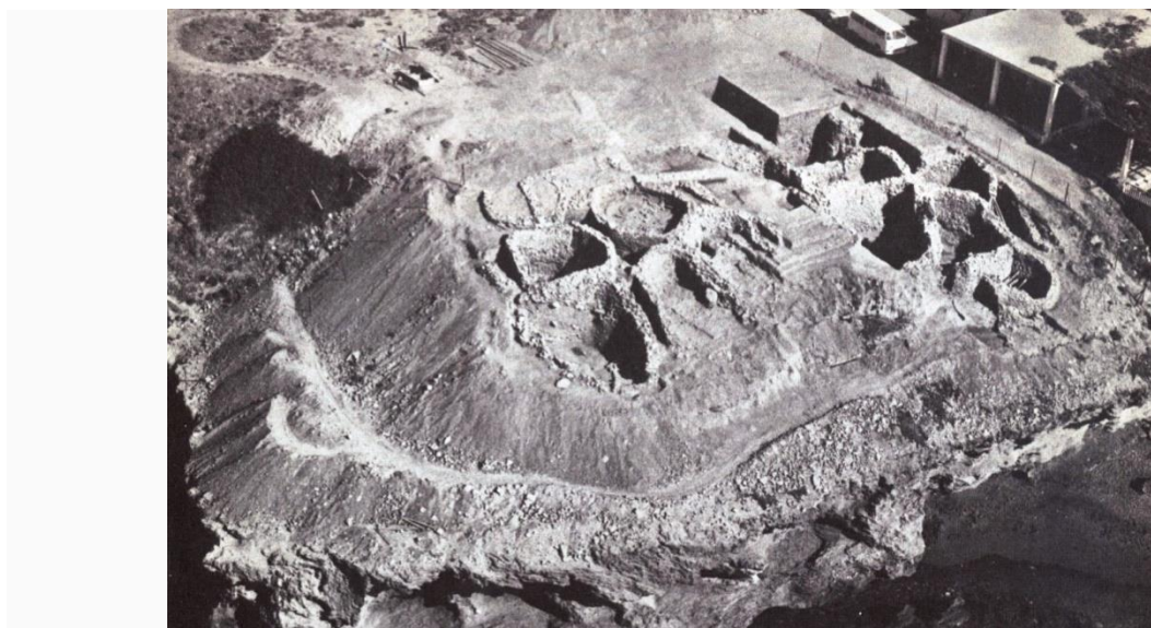
Οικισμός της Νεολιθικής εποχής στην τοποθεσία «Βρυσί» στον Άγιο Επίκτητο Κερύνειας

Για να γίνουμε πιο συγκεκριμένοι, τέτοια κατάλοιπα οικισμών της νεολιθικής εποχής, ανασκάφηκαν στο Βρυσί 2 , ένα οικισμό δίπλα ακριβώς από τη θάλασσα, σε λοφίσκο λίγο μετά τον Άγιο Επίκτητο, κάπου 10 χιλιόμετρα ανατολικά της Κερύνειας. Ένας δεύτερος και πάλι παράλιος οικισμός της ίδιας εποχής, βρέθηκε ακόμα πιο ανατολικά, στο λεγόμενο δεύτερο «Τρουλλί» 3 , ένα λόφο ακριβώς πάνω στην ακτή, κάπου 16 χιλιόμετρα, ανατολικά της Κερύνειας, ενώ ο πιο κοντινός νεολιθικός οικισμός στην πόλη της Κερύνειας, βρέθηκε στο Φουντζί 4 , μια εύφορη μικρή κοιλάδα πλούσια σε νερά, κοντά στο χωριό Κάρμι, μόλις 5 χιλιόμετρα νοτιοδυτικά της Κερύνειας.