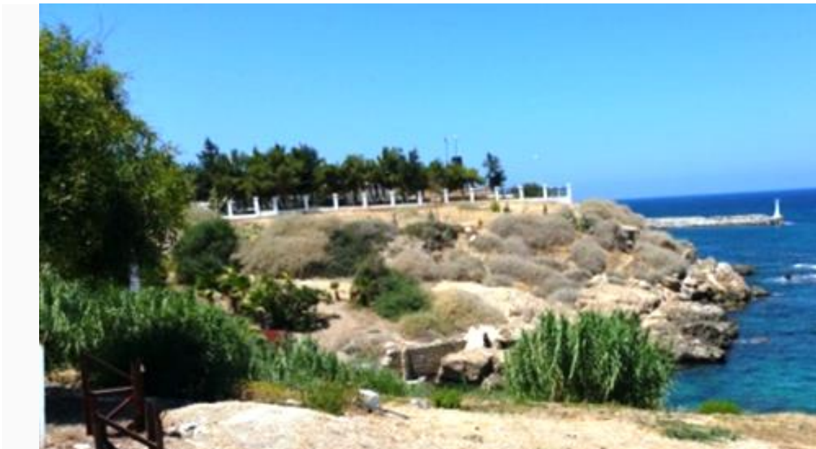
Η ανατολική χερσονήσος με το άλσος και το μνημείο που έκτισαν οι Τούρκοι.

Οι λόγοι της απόφασης για τη μη επιλογή της ανατολικής χερσονήσου από τον Κηφέα, εκτός από το μειονέκτημα του μεγαλύτερου μεν, αλλά όχι ασφαλούς λιμανιού, φαίνεται ότι ήταν, το μικρότερο μέγεθός της, το γεγονός ότι η κορυφή της, όπως και μέχρι σήμερα, δεν ήταν τόσο επίπεδη, το ότι η ανατολική πλευρά της δεν ήταν αρκετά απότομη και κατά συνέπεια λιγότερο ασφαλής, μια και έσβηνε ομαλά προς τη θάλασσα, ενώ, όπως είπαμε πιο πάνω, η λωρίδα γης που την ένωνε με την στεριά ήταν πολύ πλατύτερη σε σύγκριση με τη δυτική, πράγμα που αποτελούσε το μεγαλύτερο μειονέκτημα της. Το ότι άφηνε πλατύτερο μέτωπο στο οποίο θα έπρεπε να οργανωθεί άμυνα και αντίσταση σε περίπτωση επίθεσης εχθρών από τη στεριά και απαιτούσε την κατασκευή μεγαλύτερου τείχους σε περίπτωση ανέγερσής του για σκοπούς προστασίας της.