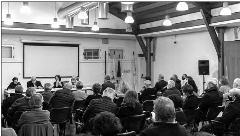
Γενική άποψη της εκδήλωσης στην Παλιά Αγορά Παλλουριώτισσας.

νηγημένοι, να γίνουν πρόσφυγες. Γεγονότα που ζήσαμε και εμείς το 1974.